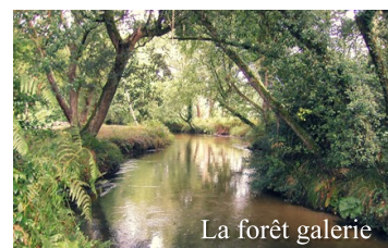
La forêt galerie