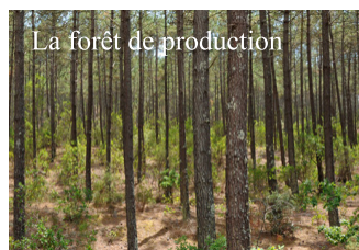
La forêt de production

La forêt-galerie située le long des rivières et des ruisseaux et qui est composée d'arbres feuillus – chênes, aulnes, saules... – Les landes rases qui n'existent plus que sur les terrains militaires de Souge, Captieux et Cazaux, et qui rappellent la lande d'avant la forêt de pins.